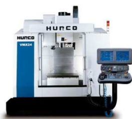
HURCO VMX 24