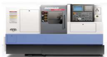
Doosan Puma 240 MC