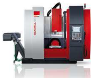
EMCO MaxxMill 500