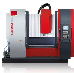
EMCO Mill 1200