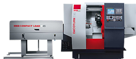
EMCO Turn 45 SMY