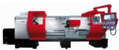
EMCO MAT E-300