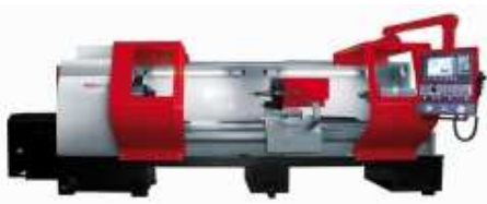
EMCO MAT E-300